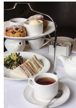
イメージ写真です

日 時 令和5年7月2日(日曜日) 9:30~14:00 主 催 山口市働く婦人の家 (一財)山口県婦人教育文化会館 北京JAC山口 対 象 一般 募集人数 20人(3講座受講の方優先、先着順) 受講料 無料 材料費 2,000円 (第1講座/無料) (第2講座/1,000円※昼食になります) (第3講座/1,000円) 申込締切 令和5年6月25日(日曜日) (消印有効)